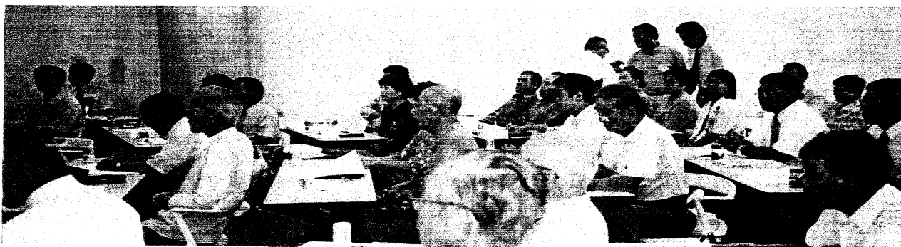
前回の第2回二神島交流会(2000年9月10日・中島町総合文化センター)

また、二神系譜研究会単独の前夜祭交流会は8月31日(土)19:00から二神集会所で開催されます。同集会所は昨年夏に空調設備が完備し快適な交流の一夜が過ごせる予定です。