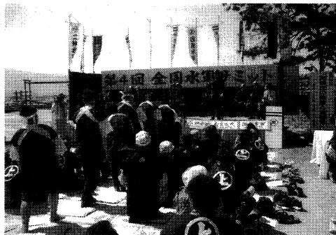
昨年度の全国水軍サミット会場