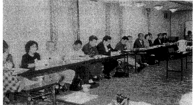
6月18日(日)吹田市サニーストンホテル

関西・中部支部の結成総会は、6月18日の午前10時から吹田市広芝町のサニーストンホテル7F会議室に37名が出席して開催されました。関西・中部地区は前夜祭も行われた関係で、その参加者も含めると合計で42名の出席となりました。